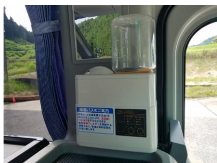
●次亜塩素酸水溶液噴霧器